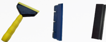
YELSQUEEG BLUESQUEEG BLAKSQUEEG