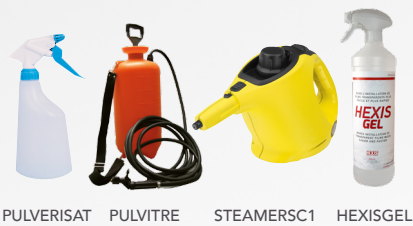
PULVERISAT PULVITRE STEAMERS C1 HEXIS GEL

Rakel mit Griff verbessern den Druck bei der Verklebung von BODYFENCE, wodurch die Entfernung von Flüssigkeit und Anwendungsgel erleichtert wird.